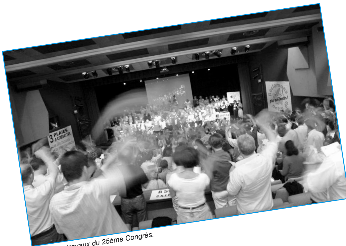
La fin des travaux du 25 ème Congrès.