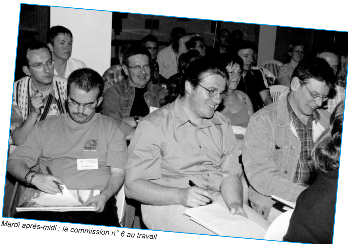
Mardi après-midi : la commission n° 6 au travail