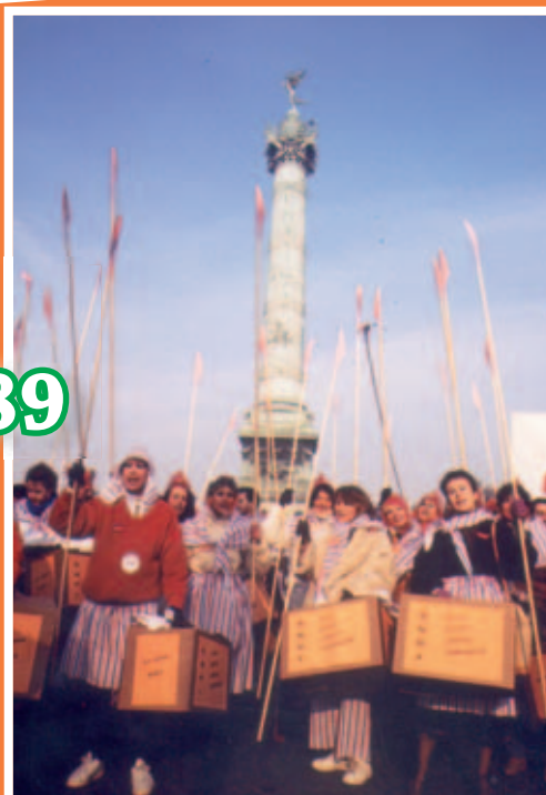
Manif février 1989