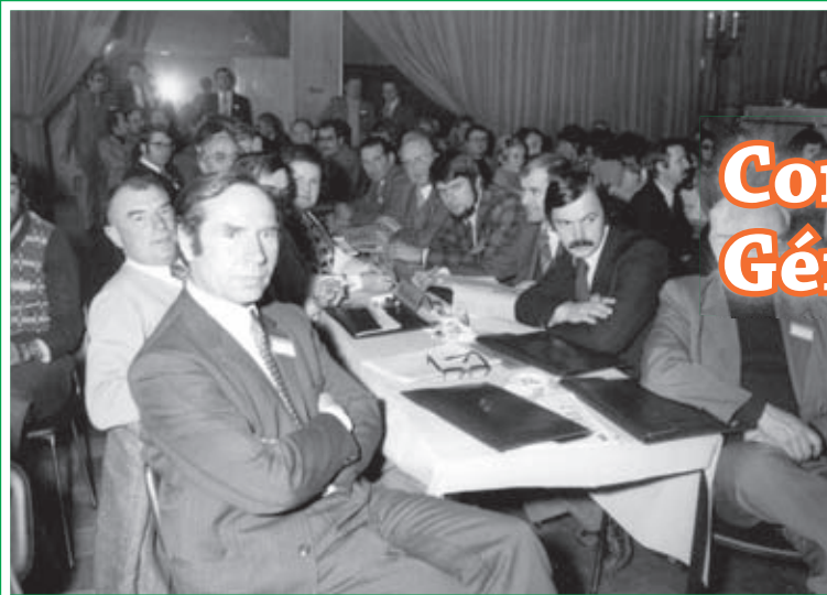
Congrès de Gérardmer 1974