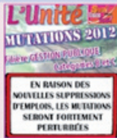
Filière GP Mutation 2012

Mutations : Frais de changements de résidence et délais de route