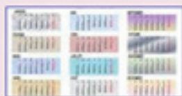
Calendrier des CAP